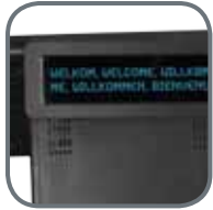
2 regel Klantendisplay VFD Type Display