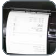
Ingebouwde printer (Aurium/Jadium/Topazium)